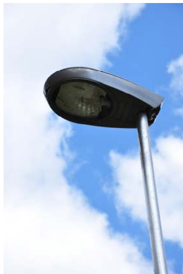
Detail stožáru pr. 133/89/60 mm