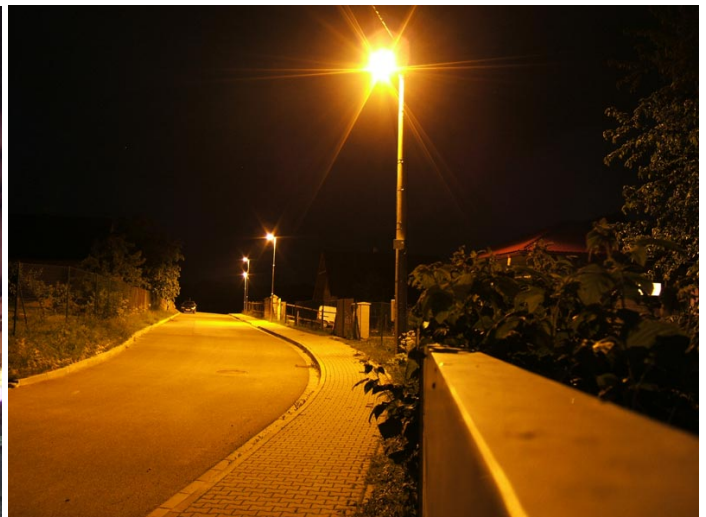
Stožár 6m ( rozteč 34 m ) ( sv.zdroj 70W sodík )