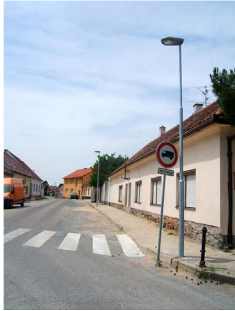
Stožár 6m ( 133/89/60 mm )