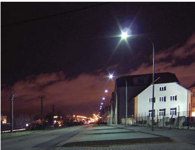
Stožár 8m+ výl.1,5m ( zdroj 100W halogenid )