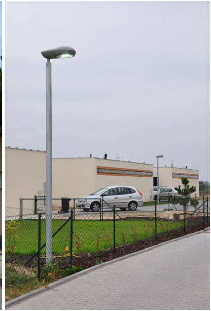
Stožár 4m ( 108 mm )