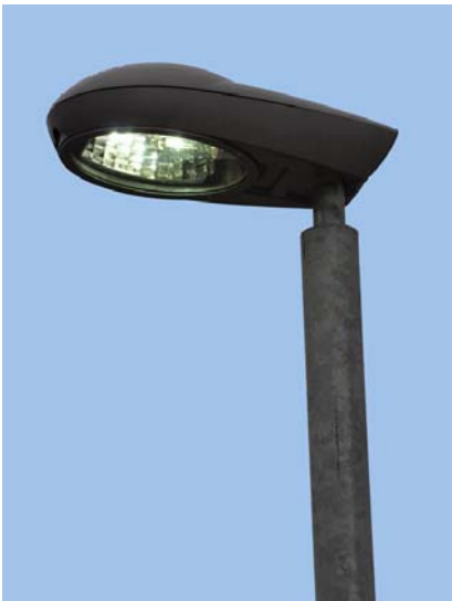
Detail stožáru pr. 108 mm